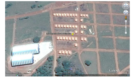
LOCALIZAÇÃO SEM ESCALA