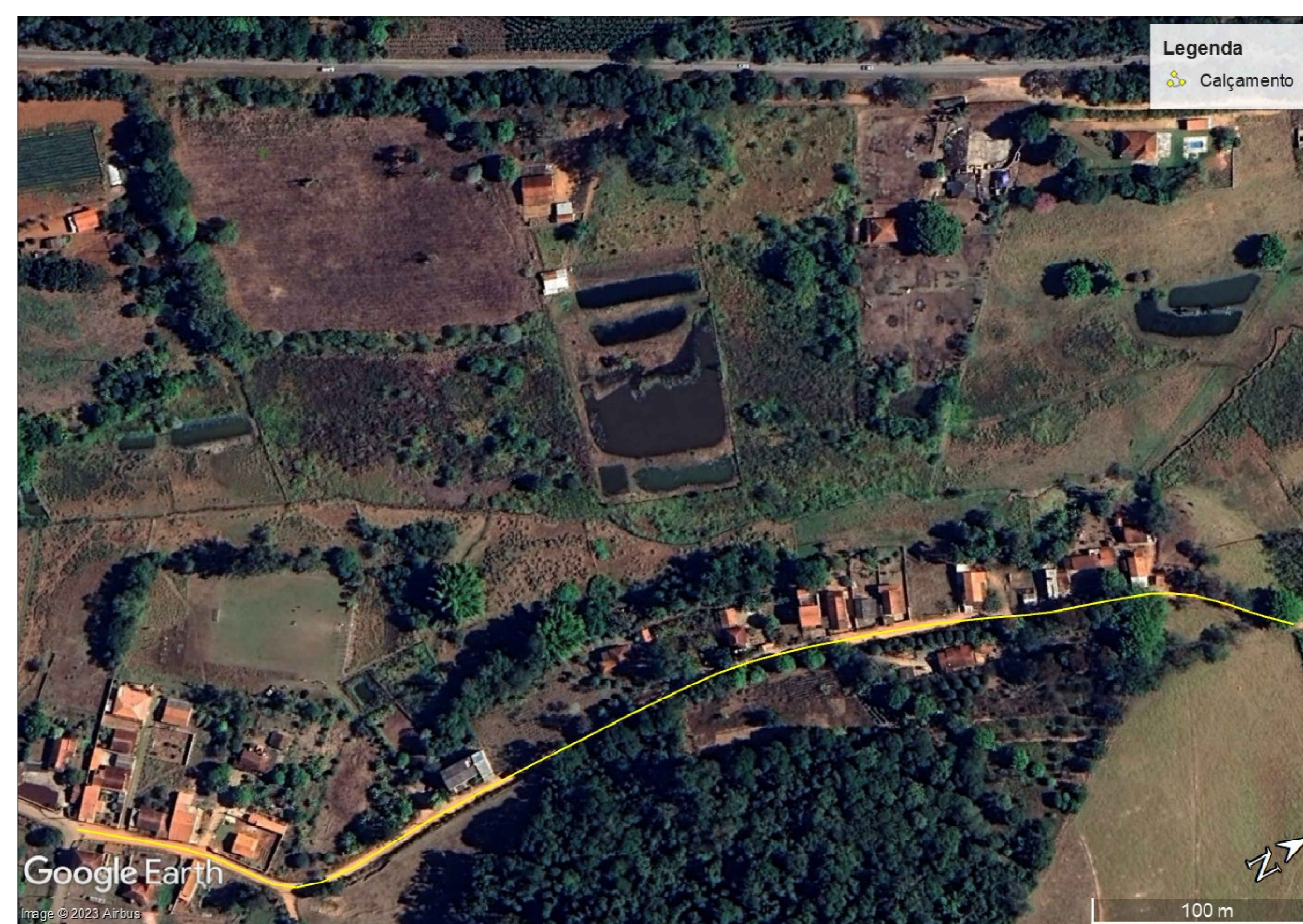
LOCALIZAÇÃO – SEM ESCALAS